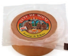
½ Laib Tête de Moine AOP vakuumpverpackt