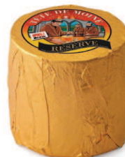
Tête de Moine AOP RESERVE Konsumreife: mind. 4 Monate