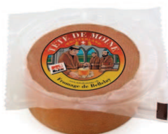
½ Laib Tête de Moine AOP vakuumpverpackt