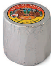
Tête de Moine AOP (Classic) Konsumreife: mind. 75 Tage