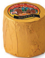
Tête de Moine AOP RESERVE Durée d'affinage: min. 4 mois