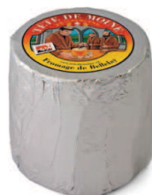
Tête de Moine AOP (Classic) Durée d'affinage: min. 75 jours