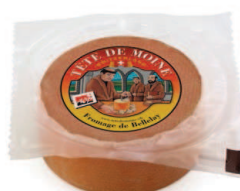
½ meule Tête de Moine AOP emballée sous vide